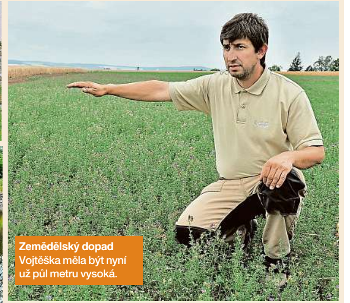
Zemědělský dopad Vojtěška měla být nyní už půl metru vysoká.