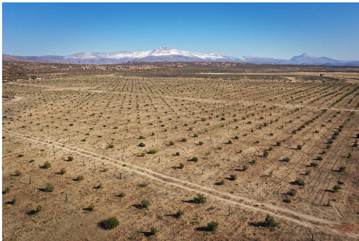
Obr. 2: Suché podmínky na lanýžových plantážích v Jihoafrické republice.